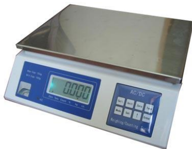
МТ В(1)ЖА «Витрина 1в»