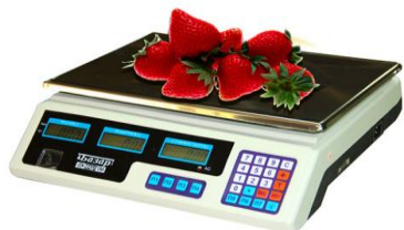
МТ М(Г)Ж(Д)А «Базар»

Пожалуйста, внимательно прочтите это руководство по эксплуатации прежде, чем Вы начнете использовать весы.