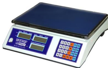
МТ М(Г)Ж(Д)А «Базар 2»

Весы электронные тензометрические для статического взвешивания настольные типа МТ М(Г)Ж(Д)А Ф-1 «Базар (2)» предназначены для определения массы и стоимости различных товаров. Весы могут использоваться для фасовки товаров на предприятиях торговли и общественного питания.