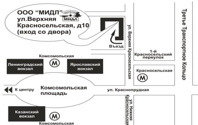
Схема проезда к офису фирмы “МИДЛ”

Филиал ООО «МИДЛ» тел/факс (499) 264-57-65, 264-57-43