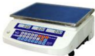
МТ МД(Ж)А «Батыр»

Пожалуйста, внимательно прочтите это руководство по эксплуатации прежде, чем Вы начнете использовать весы.