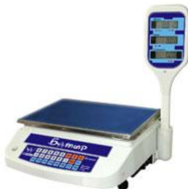
МТ МГД(Ж)А «Батыр»

Весы электронные тензометрические для статического взвешивания настольные типа МТ М(Г)Ж(Д)А «Батыр» предназначены для определения массы и стоимости различных товаров. Весы могут использоваться для фасовки товаров на предприятиях торговли и общественного питания.