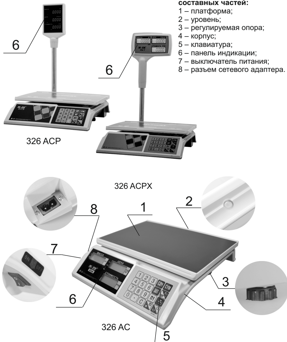
Рис. 1. Весы торговые электронные M-ER 326 AC(P)(X)