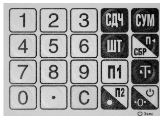
Рис. 3. Клавиатура